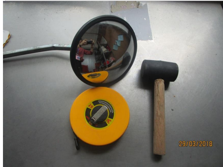
Container inspection tools